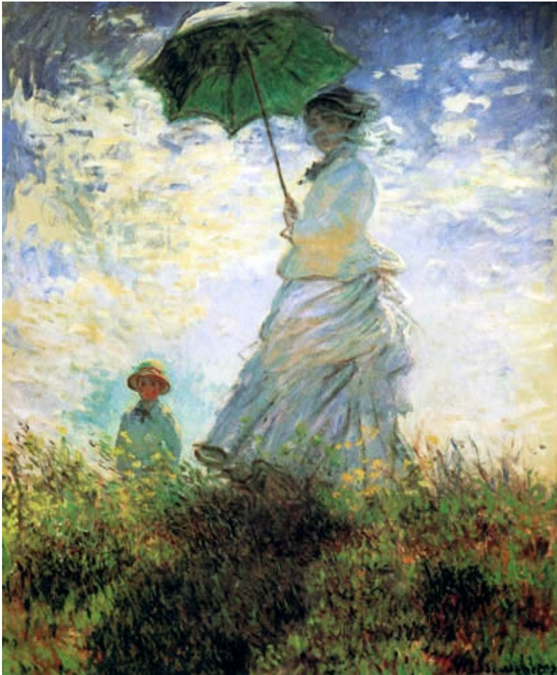
Claude Monet: Der Spaziergang (1871)