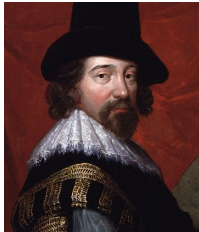
Francis Bacon (1509-1592) > “praxisbezogenes Erkennen”