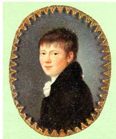
Heinrich v. Kleist (1777-1811) > “Mäeutik des Denkens”