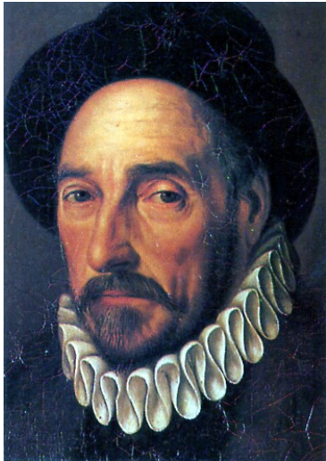
Michel de Montaigne (1533-1592) > “subjektive Erfahrung”