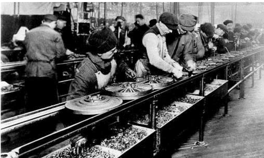
Fließbandarbeit in Amerika 20er Jahre