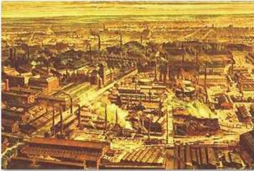
Die Krupp-Werke in Essen Ende des 19. Jahrhunderts