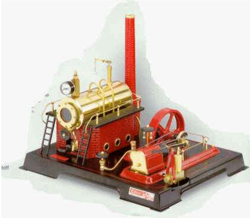
Die Dampfmaschine als Symbol der Industriellen Revolution