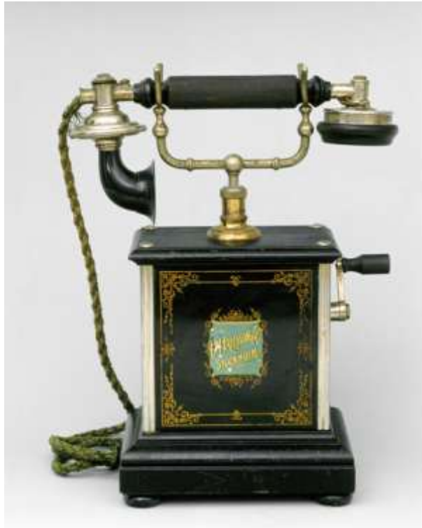
Das Telefon zur Jahrhundertwende