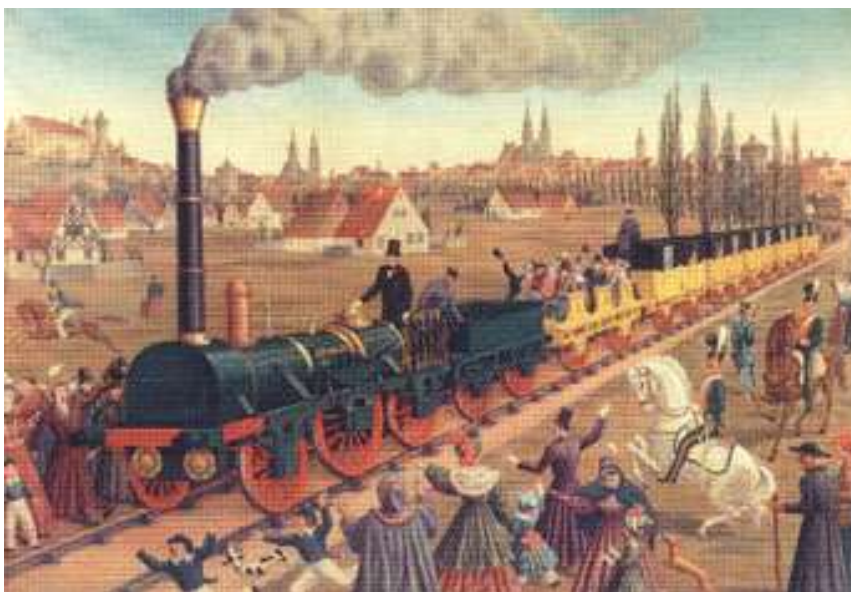
Die Eisenbahn – Motor der industrielle Revolution:

1835 Feierliche Eröffnung der ersten deutschen Eisenbahnlinie von Nürnberg nach Fürth