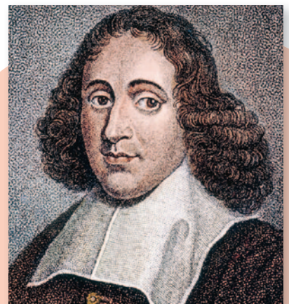
Baruch Spinoza (1632 - 1677)

Doch darf die Forderung nach Toleranz, ebenso die nach Akzeptanz der Menschen als autonome Personen keinesfalls als Indifferenz, Beliebigkeit oder Relativismus verstanden werden. Spätestens seit Spinoza Ende des 17. Jahrhunderts im berühmten 16. Kapitel seines Tractatus Theologico-Politicus die Demokratie als die der Freiheit angemessenste Form der Regierung deshalb rühmt, weil nur durch die Freiheit des Wortes eine Leitung des Staates gemäß der Vernunft möglich ist, wird die Bindung der Toleranz an die vernünftige Suche nach Wahrheit unverkennbar. Knapp zwei Jahrhunderte später rechtfertigt John Stuart Mill in On Liberty , seinem